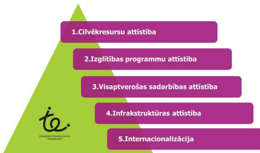
1.attēls “Tehnikuma stratēģiskās attīstības virzieni”

Projektu galvenie mērķi izriet no Tehnikuma stratēģiskajiem mērķiem (skatīt 1.attēlu).